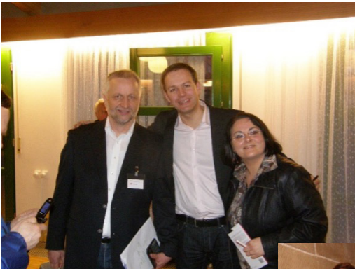
Steffen Möller in Nürnberg