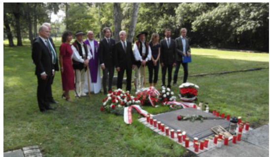
Einweihung der Namenstafel bei der Gedenkstätte für polnische Zwangsarbeiter