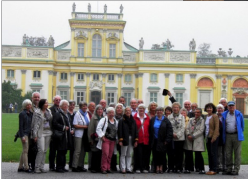
Gruppenreise nach Polen