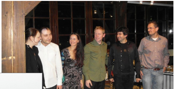
Ehemalige Stipendiaten bei einem Konzert im Krakauer Haus